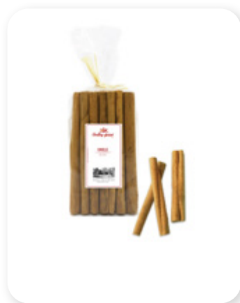
BATON DE CANNELLE Cinnamon sticks