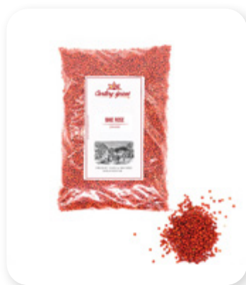
BAIES ROSES Pink Bay Beans