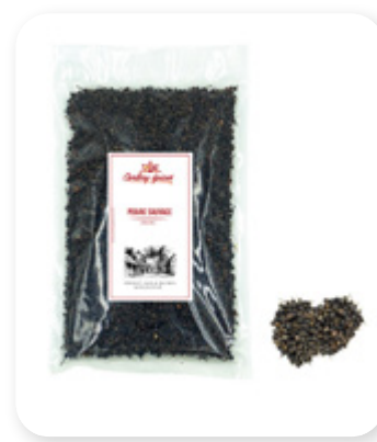
POIVRE SAUVAGE Wild Peeper