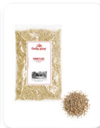
POIVRE BLANC White peeper