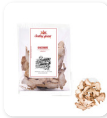
GINGEMBRE LAMELLE Ginger