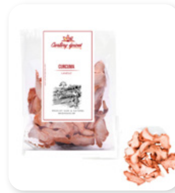
CURCUMA LAMELLE Curcuma