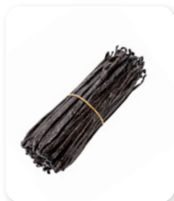
Gourmet Vanille Vanilla pods