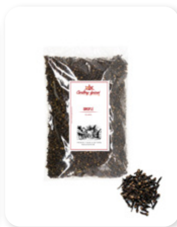
CLOU DE GIROFLE Cloves