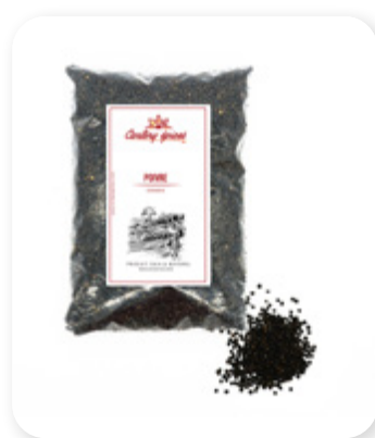
POIVRE NOIR Black peeper