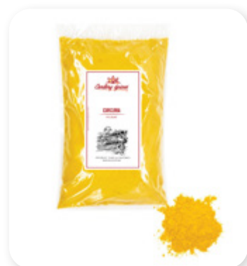
CURCUMA EN POUDRE Curcuma powder