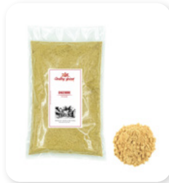
GINGEMBRE EN POUDRE Ginger powder